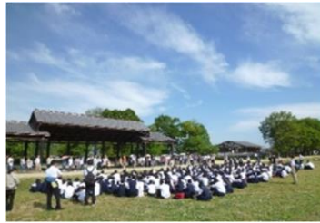
国営飛鳥歴史公園 石舞台地区 屋外：風舞台（屋根付）150名収容可 芝生広場 300名以上可