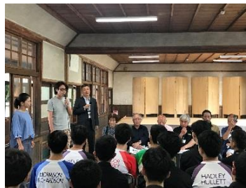
奈良カエデの郷 ひらら